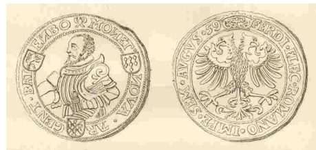
Afbeelding zilveren daalder met beeld van Willem van Bronckhorst-Batenburg

Heerlijkheid Stein: Willem, oudste zoon van Herman II van Bronckhorst-Batenburg en Petronella van Praet, was heer van Stein en Batenburg. Hij was nauw bevriend met Prins Willem van Oranje. In oktober 1572 werd hij benoemd tot luitenant-generaal van Zeeland en na het ontslag van de beruchte Lumey leidde hij in Holland als gouverneur-generaal de oorlog tegen Spanje. Hij werd op 8 juli 1573 bij Haarlem verslagen en stierf twee dagen later aan zijn verwondingen.